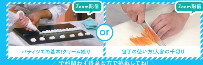
パティシエの基本! クリーム絞り