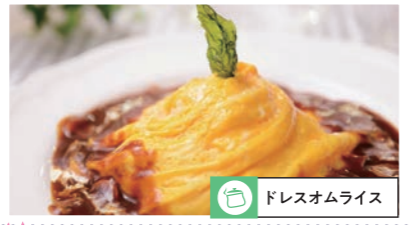
ドレスオムライス