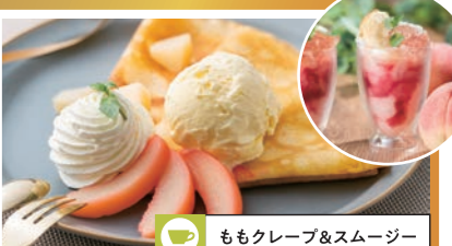
ももクレープ&スムージー